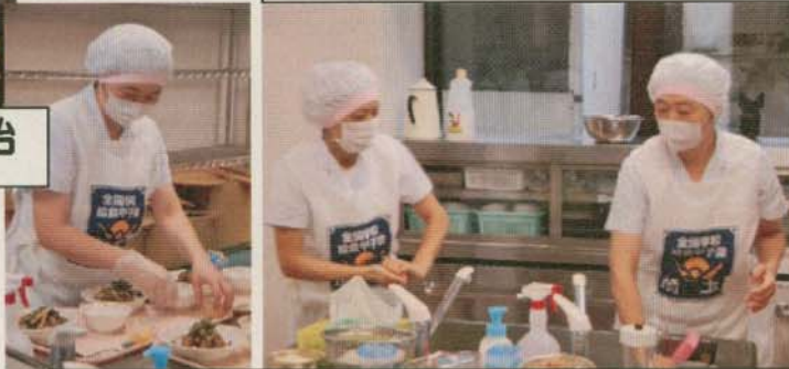
この開会式のあと調理開始