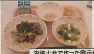
決勝大会で作った展示作品